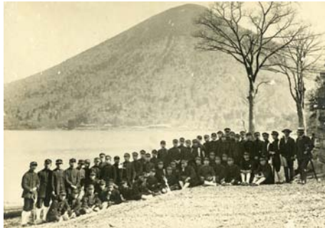
義江市郎右衛門家文書 A0181(整理中)

左：修学旅行の記録(部分) 1917年(大正6) 福井県師範学校(現・福井大学)本科女子部第4学年生の修学旅行の参加者名列・日程などが記録されています。