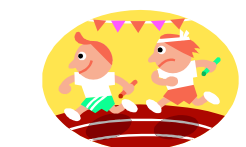
福井国体開会式 昭和43年 70562