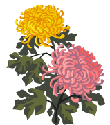
武生菊人形 昭和46年 65448